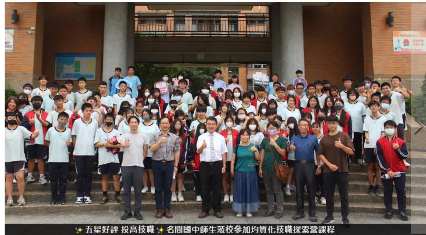
★五星好評 投高技職★名間國中師生蒞校參加均質化技職探索營課程